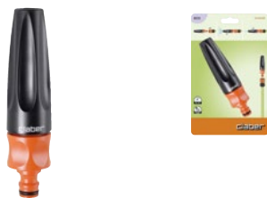
CLA8535 | in blister

Lancia con getto regolabile a piacere: da tutto chiuso a tutto aperto (concentrato o nebulizzato). Cappuccio di regolazione con fermo antisvitamento.