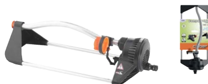
CLA8740 | in blister

Braccio oscillante in alluminio con 14 fori di precisione che garantiscono getti d'acqua uniforme e con caduta simile alla pioggia naturale. Dispositivo di selezione delle aree bagnate con posizionamento a scatto su 4 zone principali. Area massima irrigata 180 m 2 .