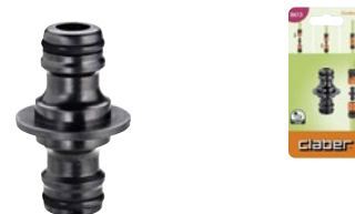
CLA8613 | in blister

Per il collegamento in serie di due tubi con raccordi automatici Quick-Click installati alle estremità.