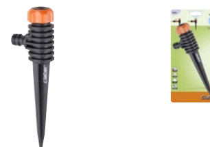
CLA8660 | in blister

Irrigatore statico a pioggia finemente polverizzata per un'area circolare. Montato su puntale. Area massima irrigata 40 m 2 .