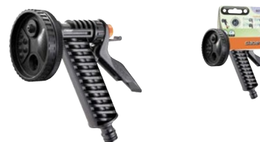
CLA9373 | in blister

Ruotando la testa della pistola si ottengono getti diversi: da diffuso a concentrato, annaffiatoio, nebulizzatore e doccia. Dispositivo per variare o bloccare il flusso.