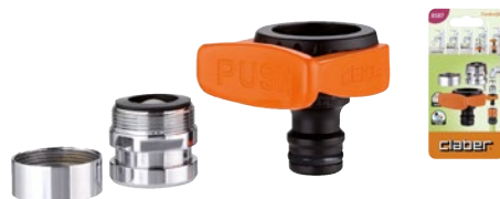
CLA8587 | in blister

Preso rubinetto 3/4" (20-27 mm) da interno per collegare un tubo al rubinetto della cucina o del bagno. Per rubinetti con filetto M da 22 mm o F da 24 mm. Connessione con forcina aggancio/sgancio a pressione. Completa di filtro aeratore rompigitto e adattatore filettato in metallo. Attacco Quick-Click. Tenuta perfetta.