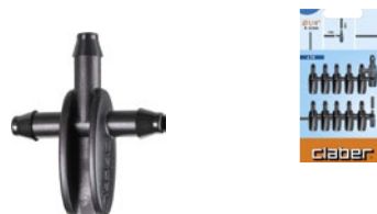
CLA91141 | in blister

Permette di raccordare tre spezzoni di tubo capillare da 1/4" (4-6 mm). Presa facilitata e tenuta perfetta senza perdite d'acqua. Blister da 10 pezzi.