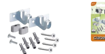
CLA8711 | in blister

Per l'installazione a parete degli avvolgitubo Claber. Dotazione completa di staffe, viti, dadi, tasselli, galletti ferma avvolgitubo.