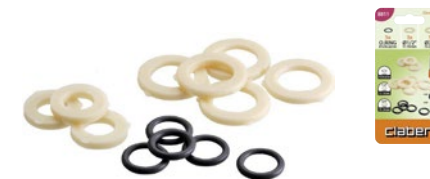
CLA8811 | in blister

Anelli di tenuta (o-ring) e guarnizioni da 1/2" e 3/4": • 3 pezzi guarnizione da 1/2" • 5 pezzi guarnizione da 3/4" • 5 pezzi OR 10,78 x 2,62 nero