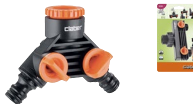
CLA8599 | in blister

Consente l'allacciamento di due linee in un'unica presa d'acqua. Rubinetti a regolazione indipendente. Installazione ad avvitamento. Filetto F da 3/4" (20-27 mm) e riduzione 1/2" (15-21 mm).