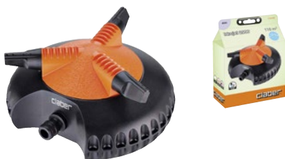
CLA8694 | in blister

Irrigatore rotante a tre braccia costruito interamente in ABS. La speciale forma arrotondata ne permette il facile trascinamento sul prato. Ugelli orientabili per ottimizzare il rendimento anche a bassa pressione. Area massima irrigata 113 m 2 .