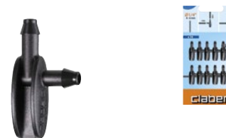
CLA91143 | in blister

Permette di raccordare ad angolo due spezzoni di tubo capillare da 1/4" (4-6 mm). Presa facilitata e tenuta perfetta senza perdite d'acqua. Blister da 10 pezzi.