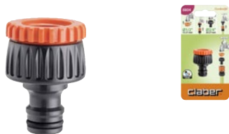
CLA8804 | in blister CLA8591 | sfuso

Per collegare al rubinetto i raccordi automatici del sistema Quick-Click. Si monta avvitando. Completa di guarnizione di tenuta. Filetto F da 3/4" (20-27 mm) e riduzione da 1/2" (15-21 mm).