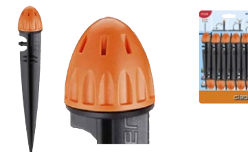
CLA91228 | in blister

Gocciolatore aspersore montato su picchetto. La portata è regolabile da 0 a 40 litri/ora. Assicura un'irrigazione precisa e localizzata ai piedi delle piante. Il suo sistema di regolazione permette di aggiustare il flusso d'acqua. Si monta all'estremità del tubo capillare da 1/4" (4-6 mm). Facilmente ispezionabile per la pulizia. Blister da 10 pezzi.