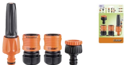
CLA8802 | in blister

Contiene presa a rubinetto 3/4" (20-27 mm) con riduzione 3/4" - 1/2" (15-21 mm), raccordo da 1/2", raccordo da 1/2" aquastop, lanciaaspruzzo.