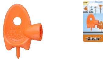
CLA91185 | in blister

Per forare il tubo collettore da 1/2" (13-16 mm). Avvita e regola i microirrigatori.