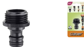
CLA8637 | in blister

Per collegare al sistema Quick-Click qualsiasi irrigatore o accessorio con filettatura F 3/4" all'entrata d'acqua.