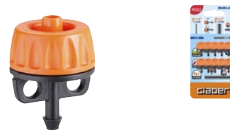
CLA91222 | in blister

Erogazione costante di 4 litri/ora a inizio e fine linea. Si applica direttamente sul tubo collettore da 1/2" (13-16 mm) o sul tubo capillare da 1/4" (4-6 mm). Smontabile per una facile pulizia. Blister da 10 pezzi.