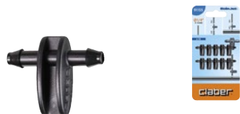
CLA91155 | in blister

Utile per derivare linee di tubo capillare da 1/4" (4-6 mm) dal tubo collettore da 1/2" (13-16 mm) o per unire due tubi capillari. Presa facilitata e tenuta perfetta senza perdite d'acqua. Blister da 10 pezzi.