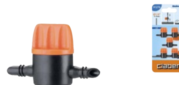
CLA91270 | in blister

Per tubo capillare da 1/4" (4-6 mm). Permette di regolare o chiudere il flusso d'acqua. Blister da 5 pezzi.