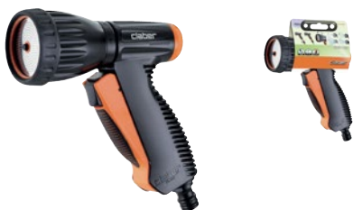
CLA9563 | in blister

Pistola multifunzione con impugnatura anatomica gommata e comodo meccanismo anteriore per apertura e chiusura del flusso. Ghiera in gomma smontabile e pulibile che gestisce quattro regolazioni di portata: doccia, concentrato, diffuso a ventaglio e nebulizzato.