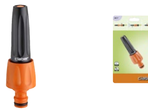
CLA8617 | in blister

Lancia con getto regolabile a piacere: da tutto chiuso a tutto aperto.