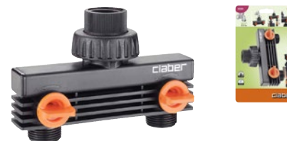
CLA8589 | in blister

Per rubinetti con filetto da 3/4" (20-27 mm). Consente il montaggio di due programmatori elettronici, riduttori di pressione, ecc. Rubinetti a regolazione indipendente.