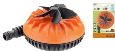
CLA8656 | in blister

Design filante e compatto per un facile spostamento sul prato. L'esclusiva elica a 5 pale rompe il getto dell'acqua e lo trasforma in una pioggia naturale e finissima. Area massima irrigata 20 m 2 .