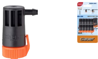
CLA91214 | in blister

Gocciolatore di fine linea per un'irrigazione localizzata. Portata regolabile 0-10 l/h, da tutto chiuso a tutto aperto. Regolazione precisa e calibrata del flusso. Si collega direttamente all'estremità del tubo capillare con un facile innesto e una perfetta tenuta. Ispezionabile per una facile pulizia. Blister da 10 pezzi.