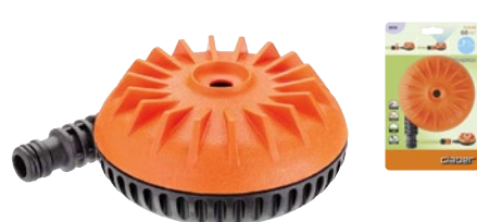
CLA8658 | in blister

Design filante e compatto per un facile spostamento sul prato. Irrigatore statico a pioggia finemente polverizzata per un'area circolare. Area massima irrigata 63 m 2 .