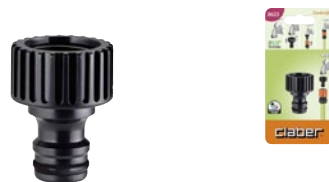
CLA8623 | in blister

Per collegare al rubinetto i raccordi automatici del sistema Quick-Click. Si monta avvitando. Completa di guarnizione di tenuta. Filetto F da 1/2" (15-21 mm).