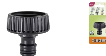
CLA8629 | in blister

Per collegare al rubinetto i raccordi automatici del sistema Quick-Click. Si monta avvitando. Completa di guarnizione di tenuta. Filetto F da 1" (26-34 mm).