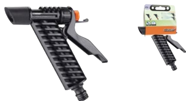
CLA8756 | in blister

Struttura robusta. Leva di regolazione del flusso e dispositivo esclusivo di selezione e fissaggio del getto desiderato.