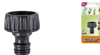
CLA8627 | in blister

Per collegare al rubinetto i raccordi automatici del sistema Quick-Click. Si monta avvitando. Completa di guarnizione di tenuta. Filetto F da 3/4" (20-27 mm).