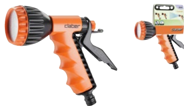
CLA8541 | in blister

Impugnatura ergonomica. Getto a doccia aperto e delicato. Leva di regolazione del flusso d'acqua. Dispositivo di blocco del getto. Piastra forata in acciaio inox.