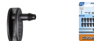
CLA91170 | in blister

Chiude i fori sul tubo collettore da 1/2" (13-16 mm) o tappa l'estremità del tubo capillare da 1/4" (4-6 mm). Presa facilitata e tenuta perfetta senza perdite d'acqua. Blister da 10 pezzi.