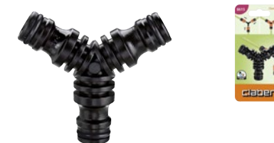
CLA8615 | in blister

Per sdoppiare la linea di irrigazione e portare l'acqua in due punti diversi. Si collegano spezzoni di tubo con raccordi automatici Quick-Click alle estremità.