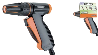
CLA9561 | in blister

Impugnatura anatomica gommata e comodo meccanismo anteriore a pulsante per apertura e la chiusura del flusso. Manopola posteriore per regolare la portata d'acqua. Getto regolabile a piacere, da tutto chiuso a (concentrato) a tutto aperto (diffuso a ventaglio).