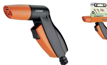
CLA9081 | in blister

Pistola a doccia leggera e compatta con doppio getto, concentrato o a ventaglio piatto. Ideale sia per annaffiare le piante che per il lavaggio. Impugnatura ergonomica. Due regolazioni di portata e chiusura flusso gestiti dal comodo pulsante anteriore.