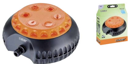
CLA8654 | in blister

Costruito interamente in ABS. La speciale forma arrotondata ne permette il facile trascinamento sul prato, tra aiuole e piante. Parte superiore sagomata per una facile presa. Ruotando la flangia si ottengono 6 funzioni diverse. Area massima irrigata 64 m 2 .