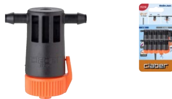
CLA91218 | in blister

Gocciolatore in linea per un'irrigazione localizzata. Portata regolabile 0-10 l/h, da tutto chiuso a tutto aperto. Regolazione precisa e calibrata del flusso. Si collega direttamente tra due spezzoni di tubo capillare con un facile innesto e una perfetta tenuta. Ispezionabile per una facile pulizia. Blister da 10 pezzi.