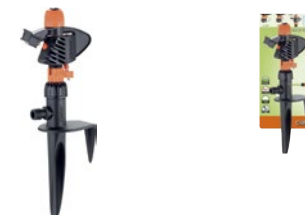
CLA8708 | in blister

Irrigatore a battente per irrigazioni a settori da 0° a 360° oppure rotazione continua, montato su picchetto in plastica a doppio puntale. Vite rompighetto per irrigazione uniforme. Autoregolazione fino a 4 bar e dispositivo di regolazione per alte pressioni. Area massima irrigata 397 m 2 .